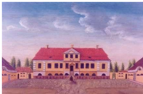
Gården Langkilde efter maleri fra 1800-tallet. Den stotelige gård blev opført efter en brand i 1802.

Lars' dåb ses midt på højre side af opslaget.