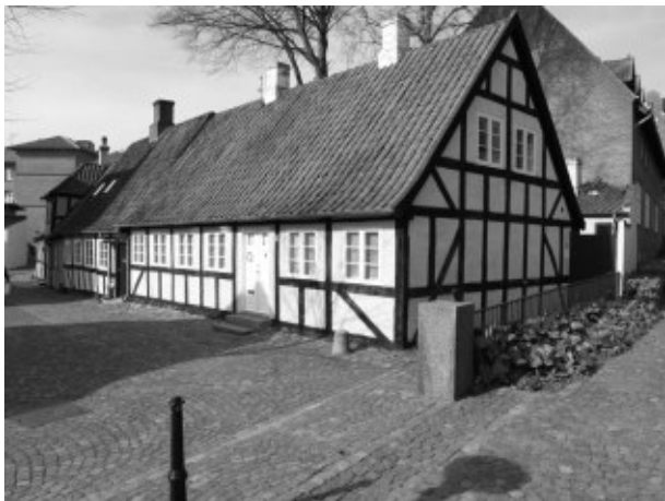
1: Kyseborgstræde no. 2 anno 2007 1

Jeg vil undersøge en ejendom i Svendborg, som min familie havde, ifølge skifterne var det fra ca. 1760 til 1849.