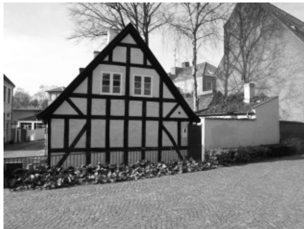
2: Kyseborgstræde no. 2 anno 2007 2